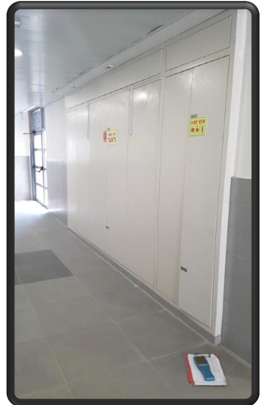
תמונה 1: חזית לוח חשמל ראשי A נמצא במבואת מסדרון מעבר קומת קרקע